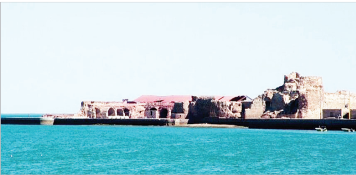
قلعه پرتغالی‌های جزیره هرمز